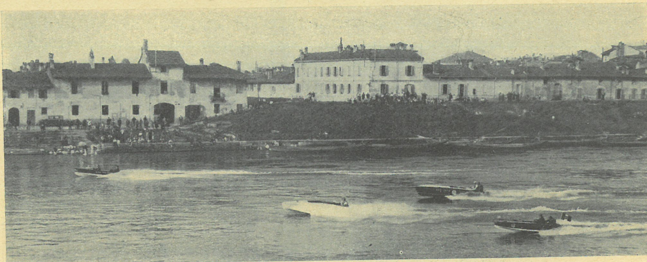
La partenza da Pavia di una delle classi concorrenti in una edizione passata.